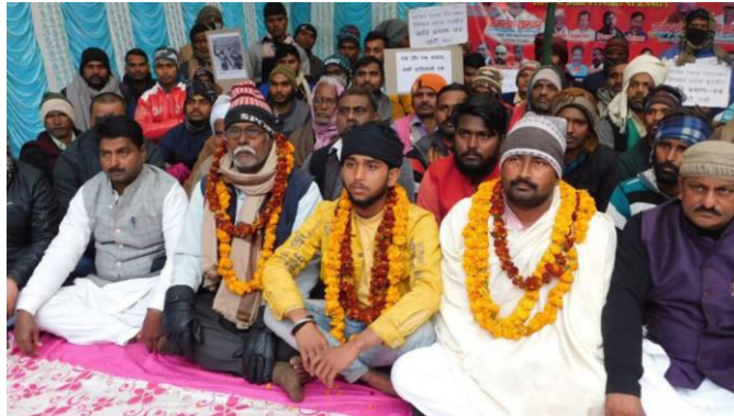
जाति प्रमाण पत्र जारी करने को लेकर खरवार समाज का क्रमिक अनशन

बिरहोर जनजाति में क्रय विवाह को सदर बापला कहा जाता है। विवाह की यह प्रथा बिरहोर में ज्यादा प्रचलित है। इस जनजाति के लोग सेवा विवाह को कीरींग जमाई बापला कहते हैं। इसमें हरण विवाह भी चलता है। उसे उडरा-उडरी बापला कहते हैं। हठ विवाह को बोला बापला कहा जाता है। उसमें युवती शादी के लिए उस युवक के घर में चली जाती है, जिसको वह प्रेम करती है। यदि युवक प्रेमी है और विवाह के लिए युवती को घर में आने को प्रेरित करता है तो उसे सीमन्दर बापला कहा जाता है। बिरहोर में प्रेम विवाह भी चलता है। इस जनजाति में विनिमय विवाह को गोलहर बापला कहा जाता है।