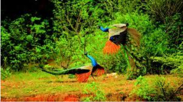
Peacocks in Aravalli biodiversity park

जिस स्थान पर अरावली जैव विविधता पार्क, गुड़गांव स्थित है, वहां 1980 और 1990 के दशक के दौरान कई खनन गड्ढे संचालित थे, और आठ सक्रिय क्रशर के साथ एक स्टोन क्रशिंग क्षेत्र भी था। 2002 में सुप्रीम कोर्ट के प्रतिबंध के बाद खनन और स्टोन क्रशिंग रुक गया, जो 2009 से ही लागू था। खनन गतिविधियों और अन्य गड़बड़ी के परिणामस्वरूप बंजर पहाड़ी ढलान, गहरे पानी की मेज और खराब मिट्टी का आवरण था। साइट पर बचे हुए जंगलों का अत्यधिक क्षरण हुआ और प्रोसोपिस जूलीफ्लोरा (स्थानीय रूप से विलायती कीकर या बावलिया के रूप में जाना जाता है) द्वारा आक्रमण किया गया। [4]