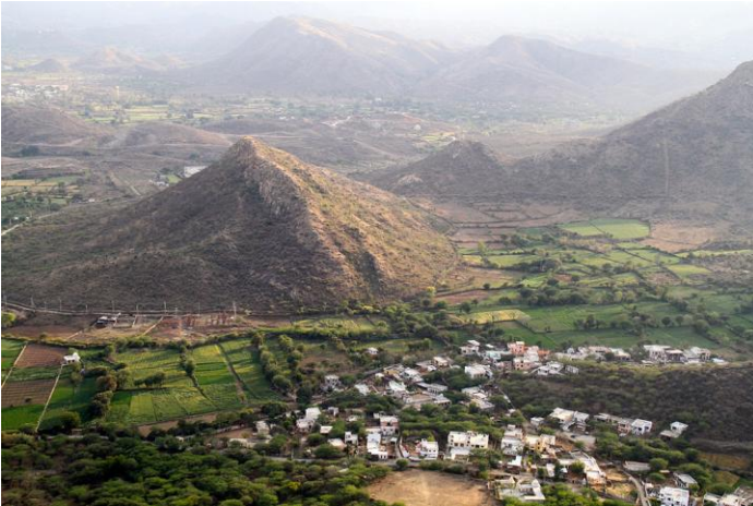
Aravalli ranges (oldest)

सबसे पुरानी अरावली पर्वत श्रृंखला जल्द ही लोगों के लिए संजीवनी बूटी का काम करने वाली है।