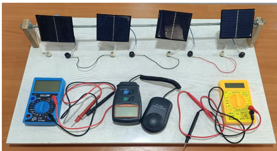
Фигура 2. Образец устройства, предназначенного для изучения принципа работы фотоэлемента в условиях педагогического образовательного кластера

По окончании опытно-экспериментальной работы был проведен математико-статистический анализ педагогической исследовательской работы и подведены итоги.