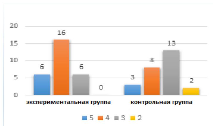
Гистограмма 2. Гистограмма показателей успеваемости учащихся в состоянии после экспериментальной работы