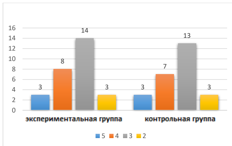
Гистограмма 1. Гистограмма показателей успеваемости учащихся в состоянии после экспериментальной работы

Учитывалось, что практическая направленность лабораторных занятий сделает занятия более интересными для студентов и позволит им лучше освоить темы. Экспериментальная группа обучалась в рамках инновационного образовательного кластера с практической направленностью тем. Занятия для контрольной группы проводились традиционно. На базе образовательного кластера были разработаны типовые планы уроков, сделан акцент на практическую направленность в преподавании каждого предмета. В качестве примера мы можем привести две лабораторные работы ниже: