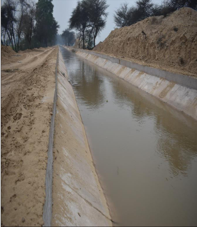
तहसील में सिंचाई का प्रमुख स्रोत (नहर)