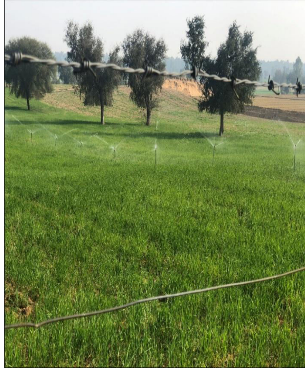
सिंचाई की आधुनिक तकनीक का उपयोग